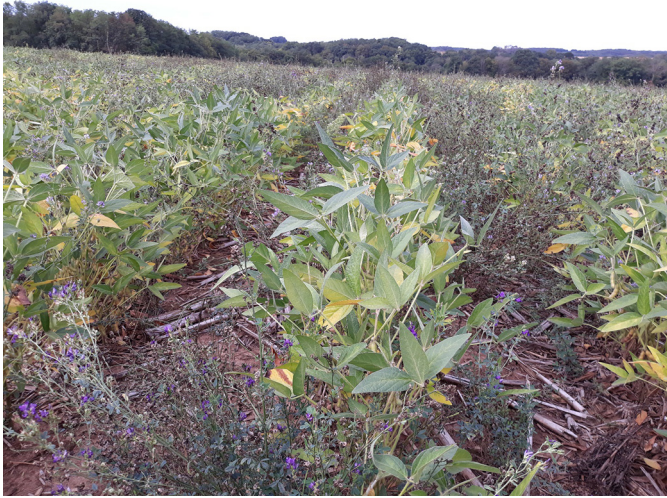
Fig. 1. Culture de soja dans un couvert permanent de luzerne. Fig. 1. Soybeans with permanent alfalfa cover.

l'agriculture biologique (Schipanski et al. , 2014), aient été déjà étudiées, il existe peu d'informations concernant l'adoption du SDSC. L'adoption du SDSC se fait-elle progressivement ou résulte-t-elle d'une modification majeure de l'ensemble des pratiques du système agricole ? Durant les premières années en SDSC, les agriculteurs ont-ils tous recours à des pratiques similaires ?